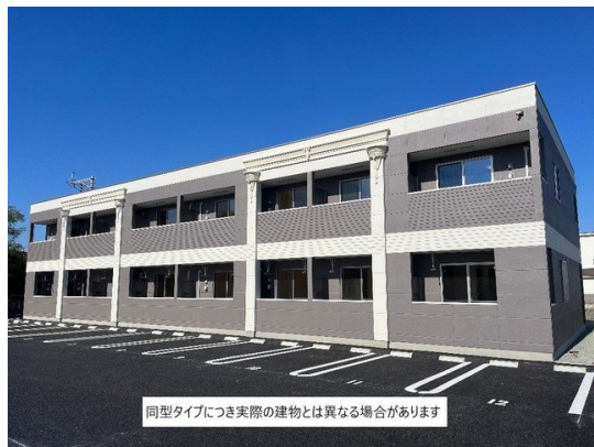
同型タイプにつき実際の建物とは異なる場合があります